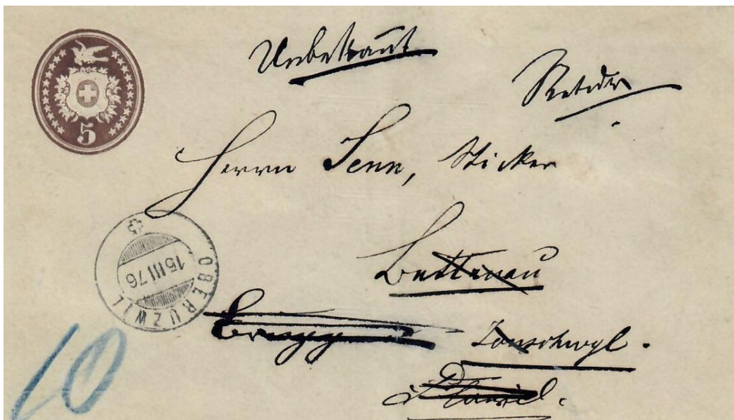
Abb. 6 OBERUZWIL - JONSCHWIL - FLAWIL - BETTNAU - BRUGGEN 15.III.1876