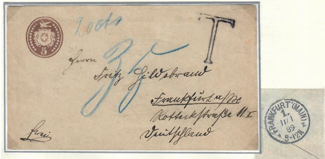
Abb. 10 ..... - FRANKFURT/M. Ankunftsstempel 1.Feb.1889

Den Abschluss bilden zwei 5 Rp. „Tübli-Ganzsachen“ im Lokalrayon von Genève, nach Paris (Frankreich) nachgesandt. (Abb. 11 und 12).