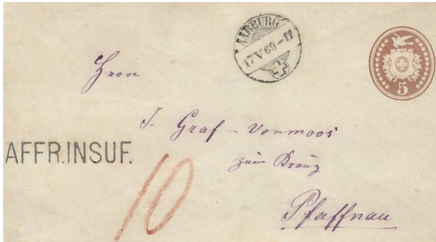
Abb. 2 AARBURG - PFAFFNAU 17.V.1869

Die Taxierungsvariante anderer Art belegt ein weiterer 5 Rp. „Tübli“ (Werteindruck rechts, Abb. 3). Der Brief (bis 10g) war zunächst im Lokalrayonversand mit dem Wertstempel korrekt freigemacht. Offenbar hatte die Sendung am 1. Zielort in Lancy „den Postweg bereits verlassen“, als man erkannte, dass die Adressatin in Vevey weilte. Mit der neuen Adresse erfolgte die Inland-Nachsendung , allerdings unfrankiert! Der 5 Rp. Wertstempel hatte nun keine Gültigkeit mehr, was dazu führte, dass die Adressatin das volle Inlandbriefporto von 10 Rp. beim Empfang des Briefes zu bezahlen hatte.