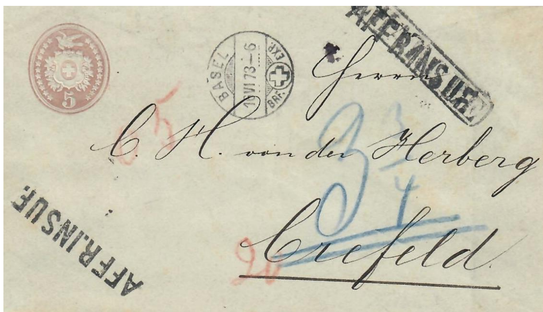
Abb. 9 BASEL - KREFELD 16.VI.1873