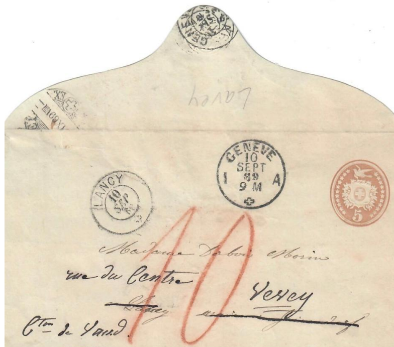
Abb. 3 GENÈVE - LANCY - VEVEY 10.Sept.1869