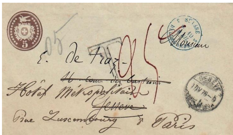
Abb. 11 GENÈVE - PARIS 17.IV.1876