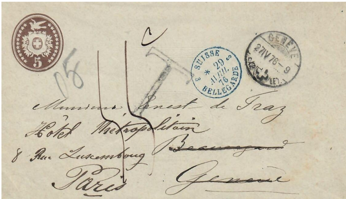
Abb. 12 GENÈVE - PARIS 27.IV.1876