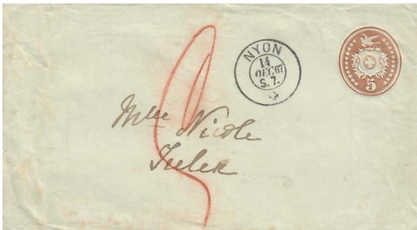
Abb. 1 NYON - TRELEX 14.Dez.1867