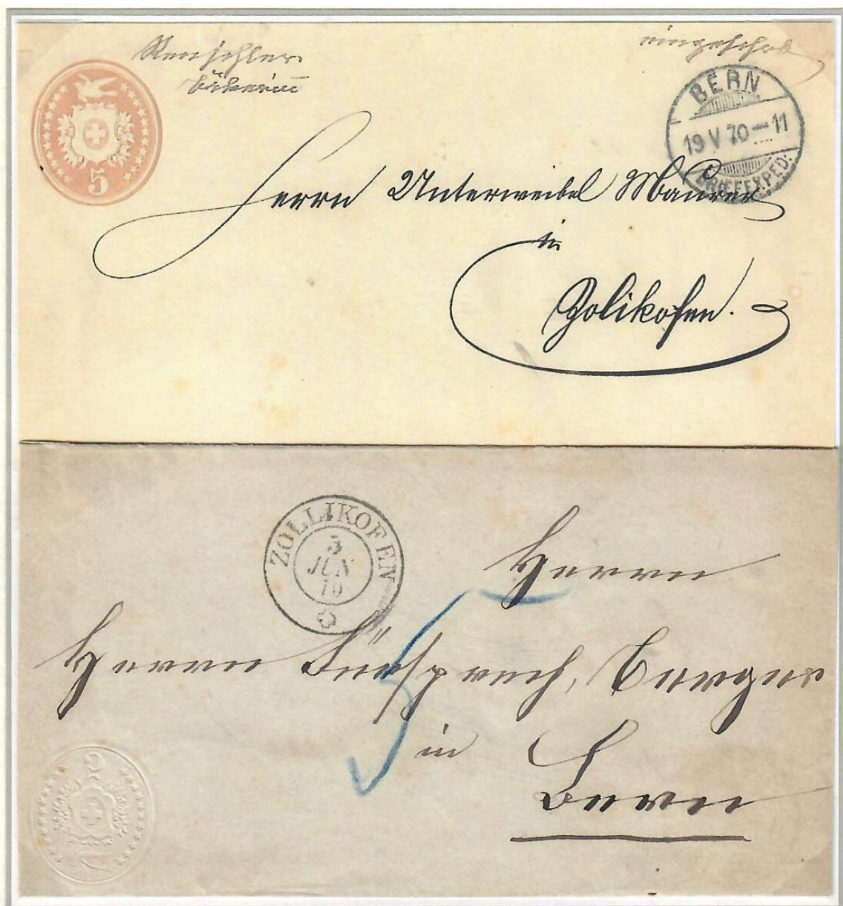
Abb. 4 BERN - ZOLLIKOFEN - BERN 19.V.1870 u. 5.Juni 1870