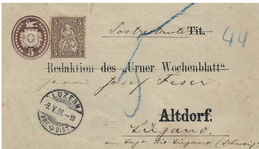
Abb. 8 LUZERN - ALTDORF 9,V.1896