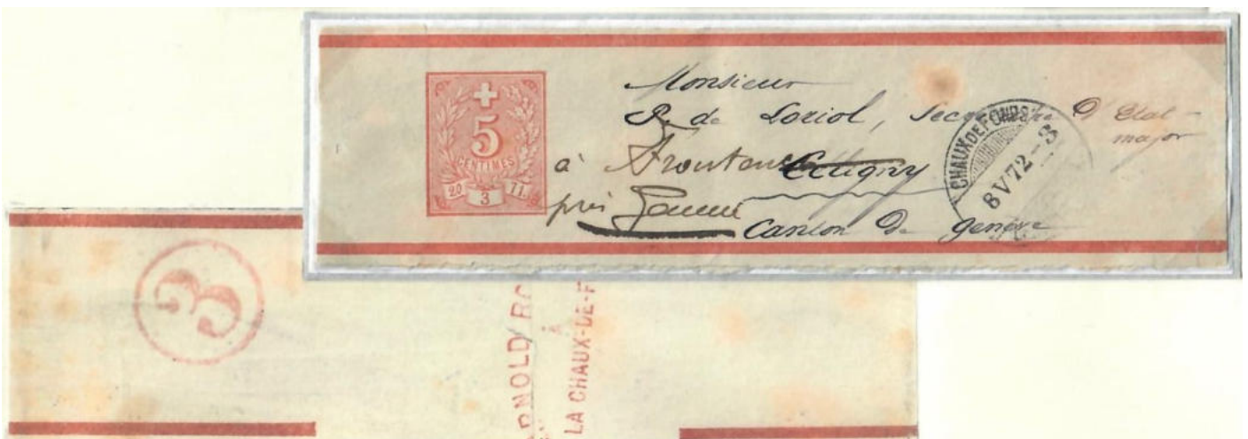
Abb. 1: Chaux-de-Fonds - Céligny - Frontenex 8.V.1872 (Vorder- und Rückseite)

So konnte z.B. ein Band mit Werteindruck 5 Rp. im Inlandverkehr (inkl. Nachsendung) tarifgerecht für die zweite Gewichtsstufe (über 40 - 250g) gebraucht werden.