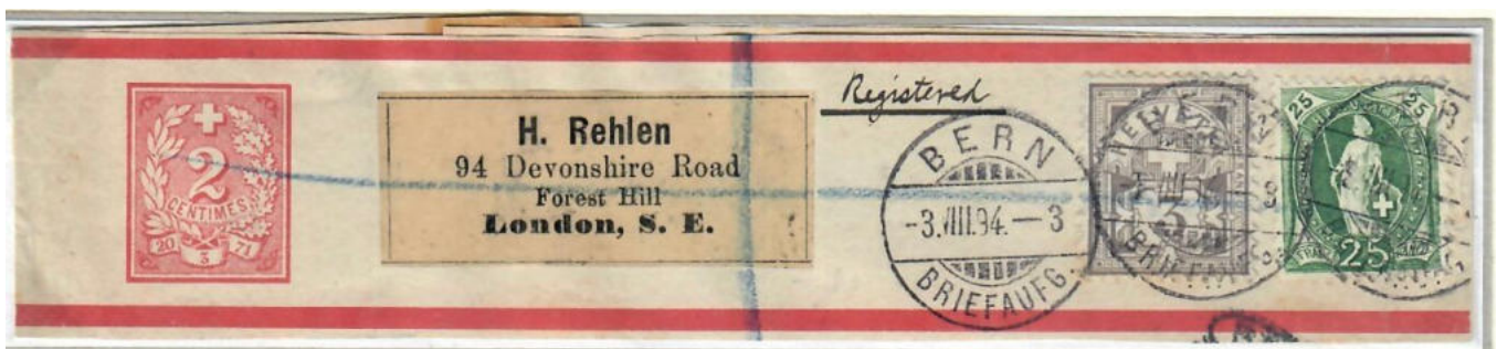
Teilansicht der Band-Rückseite

Das Streifband hatte Gültigkeit bis zum 31.12.1924! In dieser Form vermutlich ein UNIKAT!