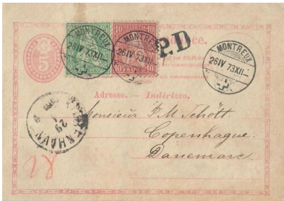
Abb. 14: MONTREUX - KOPENHAGEN 26.IV.1873

Die „Reise“ der frühen Korrespondenzkarten durch Europa endet mit einem Highlight (im wahrsten Sinne des Wortes), nämlich in dem Vor-UPU-Land Dänemark (Abb: 14)! Das tarifliche „Ausseren“ zur 40 Rp. Frankatur ist wahrlich ungewöhnlich für eine Korrespondenzkarte dieser Zeit in Europa. Es wird aber begründet durch die Tatsache, dass Briefe nach Dänemark ebenfalls mit diesem Portosatz belegt werden mussten. Das Land hatte - vergleichsweise zu anderen europäischen Ländern - nie einen Postvertrag mit der Schweiz , was wohl auch der Grund dafür war, dass es mit Dänemark für Briefpostsendungen nie eine „direkte Auswechslung“ gab . Die Rötelnotiz „28“ (links unten) verrät uns, dass die Schweiz ein Weiterfranko von 28 Rp. an das Transitland Deutschland zu vergüten hatte. Ich nehme das Wort „UNIKAT“ nur ungern in den Mund, hier aber ist es wohl zutreffend