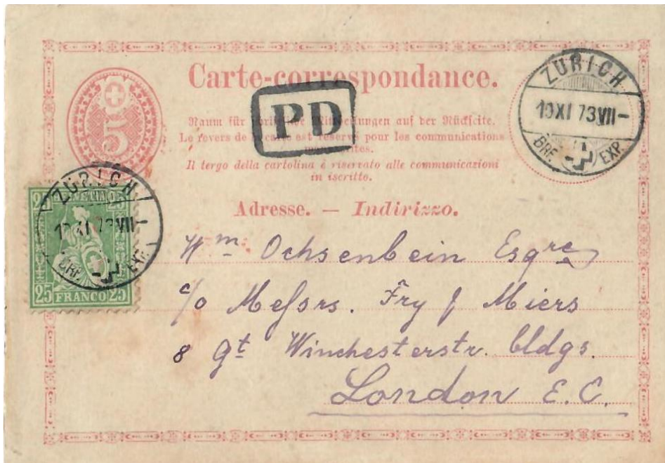
Abb. 13: ZÜRICH - LONDON 19.XI.1873

Die „Reise“ der frühen Korrespondenzkarten durch Europa endet mit einem Highlight (im wahrsten Sinne des Wortes), nämlich in dem Vor-UPU-Land Dänemark (Abb: 14)! Das tarifliche „Ausseren“ zur 40 Rp. Frankatur ist wahrlich ungewöhnlich für eine Korrespondenzkarte dieser Zeit in Europa. Es wird aber begründet durch die Tatsache, dass Briefe nach Dänemark ebenfalls mit diesem Portosatz belegt werden mussten. Das Land hatte - vergleichsweise zu anderen europäischen Ländern - nie einen Postvertrag mit der Schweiz , was wohl auch der Grund dafür war, dass es mit Dänemark für Briefpostsendungen nie eine „direkte Auswechslung“ gab . Die Rötelnotiz „28“ (links unten) verrät uns, dass die Schweiz ein Weiterfranko von 28 Rp. an das Transitland Deutschland zu vergüten hatte. Ich nehme das Wort „UNIKAT“ nur ungern in den Mund, hier aber ist es wohl zutreffend