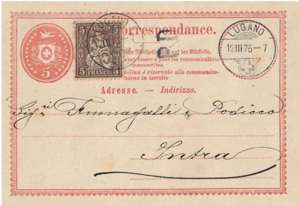
Abb. 1: LUGANO - INTRA (ITALIEN) 12.III.1875

Von Lugano nach Intra war die Korrespondenzkarte dem Taxgrenzpunkt 5 - Cannobio - zugeordnet. Beide Orte, Lugano sowie Intra , lagen innerhalb des Distanzbereichs von 45 km Luftlinie zu Cannobio. Deshalb konnte die Korrespondenzkarte zum reduzierten Brieftarif von 10 Rp. frankiert nach Intra versandt werden. Bereits 3 Monate später (ab 1.Juli 1875) wurde der Grenzrayon mit Italien aufgehoben und eine Postkarte hatte nach ganz Italien ab diesen Zeitpunkt einen eigenen Tarif, nämlich generell 10 Rp.