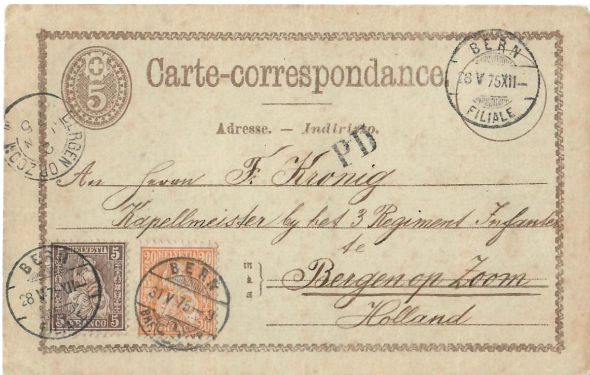
Abb.12: BERN - BERGEN OP ZOOM (HOLLAND) 28.V. und 31.V.1875

Der Weg der Länderdestinationen führt uns aus der Schweiz direkt nach Holland , wohin eine Korrespondenzkarte nach wie vor mit dem Briefftarif von 30 Rp. zu frankieren war (Abb. 12). Verwendung fand dazu abermals eine 5 Rp. Inlandkarte (Zst.Nr.5). Wenn man sich über Jahre mit der Thematik der Schweizer Posttarife des 19. Jahrhunderts beschäftigt, wird der Eindruck vom „roten Faden“ der Unsicherheit resp. Unwissenheit - sowohl im Publikum und manchmal bei der Aufgabepost selbst - in Bezug auf das korrekte Frankieren „früher“ Korrespondenzkarten immer wieder deutlich. Vorliegendes Belegbeispiel bestätigt diese Erkenntnis zum wiederholten Male.