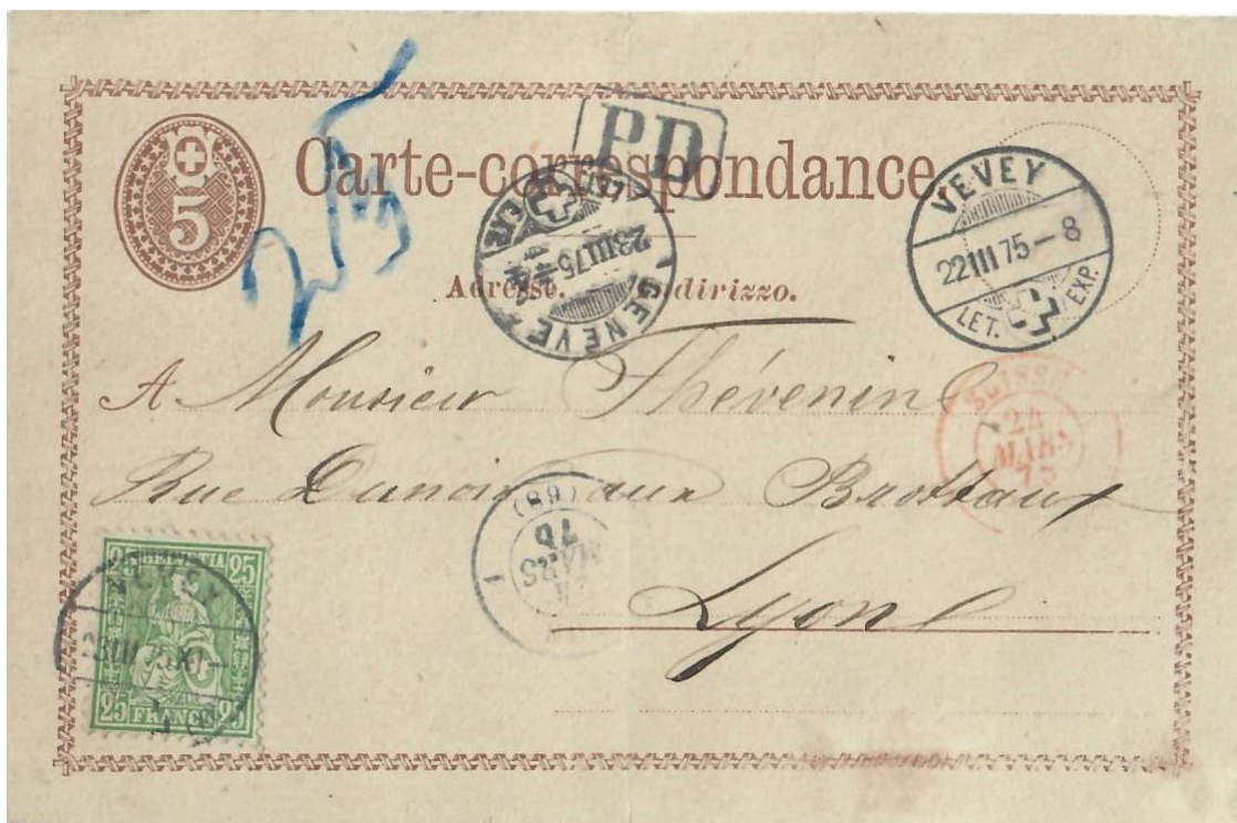
Abb. 7: VEVEY - LYON 22. und 23.III.1875

In Verbindung mit einer Schweizer Korrespondenzkarte (der 3.Ausgabe) sehen wir abermals den 30 Rp. Brieftarif nach Frankreich . Dieses Mal brauchte es aber „zwei Stationen“ zur korrekten Frankatur (Abb. 7). Die 5 Rp. Karte mit Adresse in Lyon wurde am 22.III.1875 ohne Zusatzfrankatur aufgegeben, war also um 25 Rp. zu wenig frankiert . Rechtzeitig wurde die unzureichende Gebühr bemerkt und die fehlenden 25 Rp. einen Tag später (am 23.III.1875) zum ordentlichen Tarif von 30 Rp. nachfrankiert .