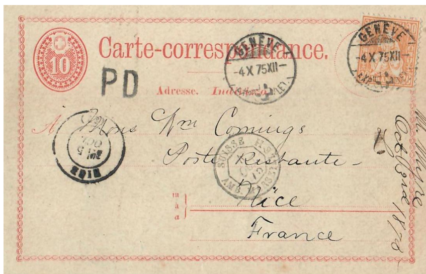
Abb. 9: GENÈVE - NIZZA 4.X.1875

In all den Jahren, seitdem mich Korrespondenzkarten mit Brieffarif ins Ausland faszinieren, fiel mir immer wieder auf, dass man sie mit der erst 1874 ausgegebenen Auslandkarte (Werteindruck 10 Rp., Zst.Nr.7) nur höchst selten sieht. Eines der wenigen Exemplare, das ich in diesem Zusammenhang besitze, ist ebenfalls eine Karte nach Frankreich, richtig mit einer 20 Rp. Zusatzfrankatur auf 30 Rp. Brieffarif ergänzt .