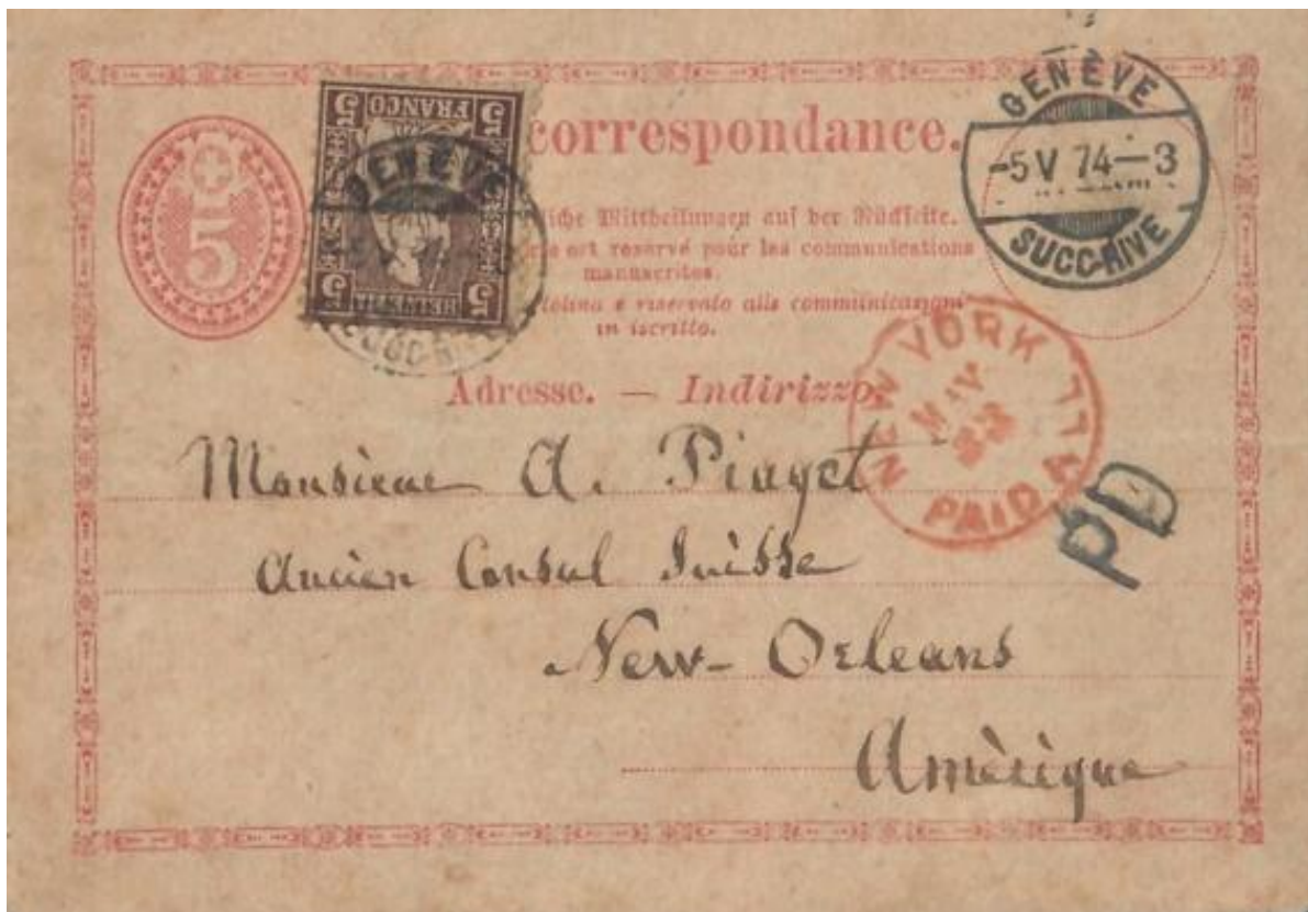
Abb. 17: GENÈVE - NEW-ORLEANS 5.V.1874

Die USA waren somit das einzige Land, mit dem die Schweiz 14 Monate vor Mitgliedschaft beider Länder im Weltpostverein den wechselseitigen Postkartenaustausch von 10 Rp. resp. 2 Cent aus den USA in die Schweiz vollzog. (Abb: 17, 18 +19) Es war bereits der Tarif, wie er ab dem 1.Juli 1875 für beide UPU-Mitgliedsländer weiterhin Bestand hatte.