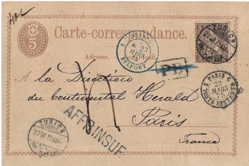
Abb. 8: ZÜRICH - PARIS 22.III.1875

Immer wieder wird der beschriebene „rote Faden“ der Unsicherheit beim Frankieren von Korrespondenzkarten der ersten Jahre offensichtlich (Abb. 8). Es sind Belegbeispiele wie das Nächste, das eine Karte zeigt, die frankiert ist, wie sie erst ab 1.1.1876 einer korrekten Frankatur nach Frankreich entsprach, nämlich mit 10 Rp. (5 Rp. Ganzsache + 5 Rp. Ergänzungsmarke). Hier fehlten jedenfalls zum 30 Rp. Brieffarif noch 20 Rp.!