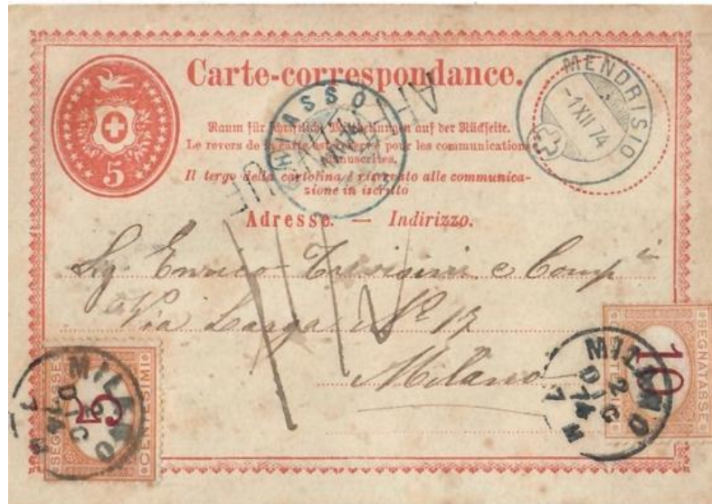
Abb. 3: MENDRISIO - MILANO 1.XII.1874

Es ist wohl nicht übertrieben zu behaupten, dass mit wenigen Ausnahmen fast alle Korrespondenzkarten ins Ausland aus dieser kurzen Epoche zu den kleinen- über mittleren- bis zu grösseren Tarifrarityäten zu zählen sind. Das nächste Beispiel zeigt uns zum wiederholten Male eine Korrespondenzkarte in den Grenzrayon nach Italien (Abb: 3). Dieses Mal unzureichend frankiert! Es fehlten 5 Rp. Ergänzungsfrankatur zum ermässigten RL-Brieftarif von 10 Rp.! In der Folge wird anschaulich die postalische Behandlung einer solchen Sendung erläutert.