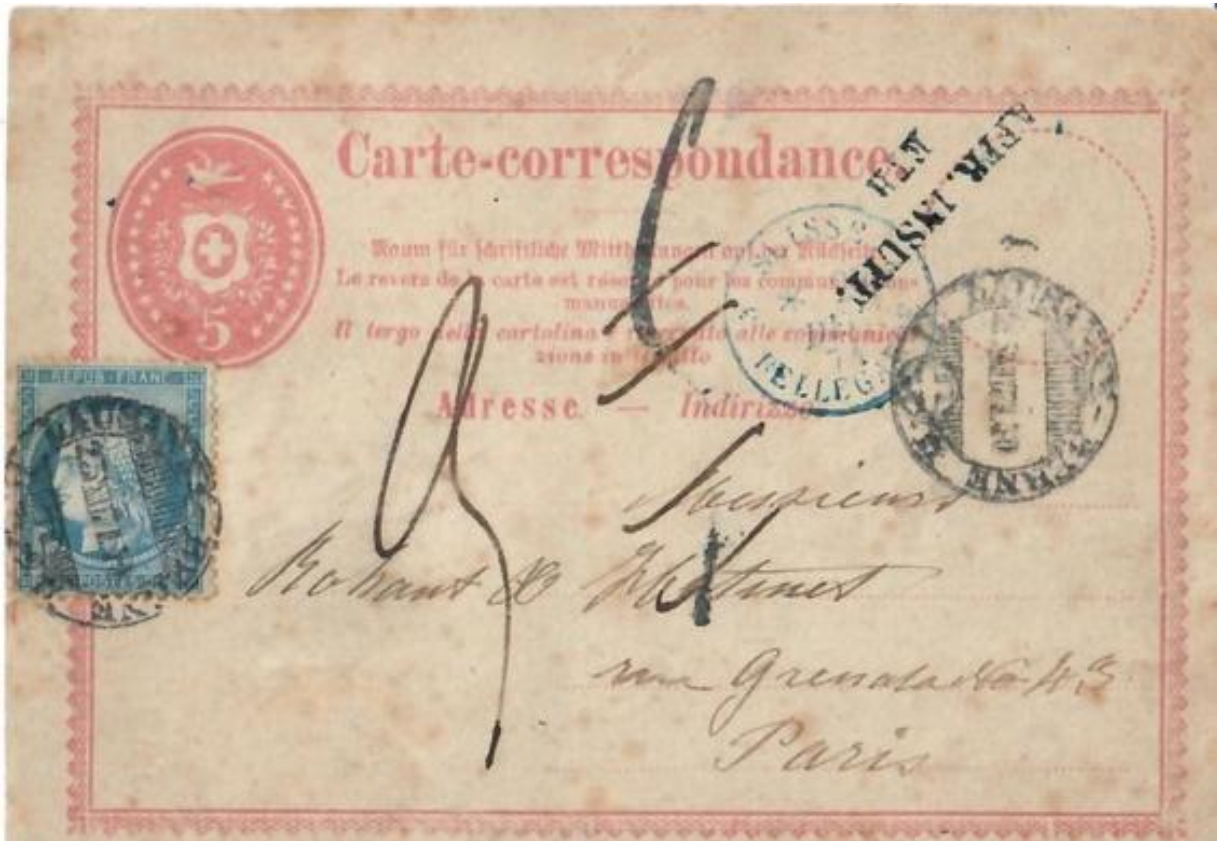
Abb. 5: LAUSANNE - PARIS 23.XII.1871

Auch nicht gerade häufig sind Korrespondenzkarten in das Nachbarland Frankreich, frankiert mit 30 Rp. Brieftarif. Dennoch findet man sie vergleichsweise zu anderen Ländern noch am ehesten. Allerdings, eine Karte wie (Abb: 5), darf in ihrer Frankaturen-Darstellung als äusserst ungewöhnlich bezeichnet werden.