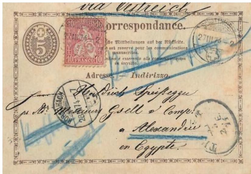
Abb. 15: SCHAFFHAUSEN - ALEXANDRIEN 27.III.1874

Was Überseeländer betrifft , in Verbindung mit den „frühen“ Korrespondenzkarten aus den Jahren vor Eintritt in den Weltpostverein , kennt man meines Wissens bis heute keine Belege, die mit „Brieffarif“ frankiert sind , obwohl es möglich war. Trotzdem, für Länder in Übersee wie Ägypten und die USA , die ab 1.Juli 1875 zu den ersten 22 UPU-Mitgliedsstaaten gehörten, gab es in der Zeit noch vor ihrer UPU-Mitgliedschaft tarifliche Ausnahmeregelungen. So hatte z.B. Österreich mit der Schweiz (lt.PA-Blatt 1, Art.4) vereinbart, dass ab dem 1.Feb.1873 Korrespondenzkarten nach Alexandrien (Ägypten) mit der moderierten Taxe von 15 Rp. frankiert dorthin versandt werden können (Abb: 15 und 16). Voraussetzung war, nur bei Leitung über Österreich (Triest), und Auslieferung über das dortige österreichische Ausland-Postamt! Der Tarif war knapp 2½ Jahre gültig, bis zum 30.6.1875! Man kennt bis heute weniger als zehn Korrespondenzkarten dorthin.