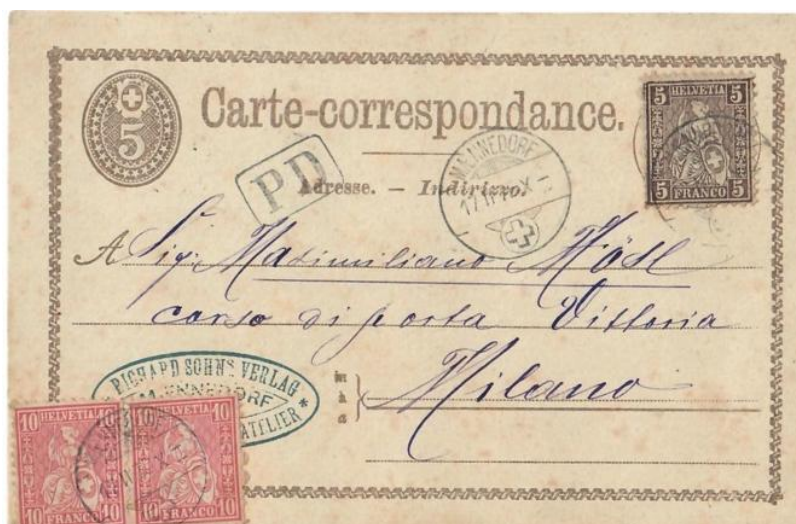
Abb. 4: MÄNNEDORF - MILANO 17.II.1875

Im Fernverkehr mit Italien stellt sich gar noch eine Korrespondenzkarte der dritten Ausgabe (Ausgabe April 1874) mit der Brief frankatur von 30 Rp. vor (Abb: 4)! Das ist insofern beachtenswert, weil der ohnehin seltene Tarif mit dieser Kartentype nur noch 15 Monate möglich war.