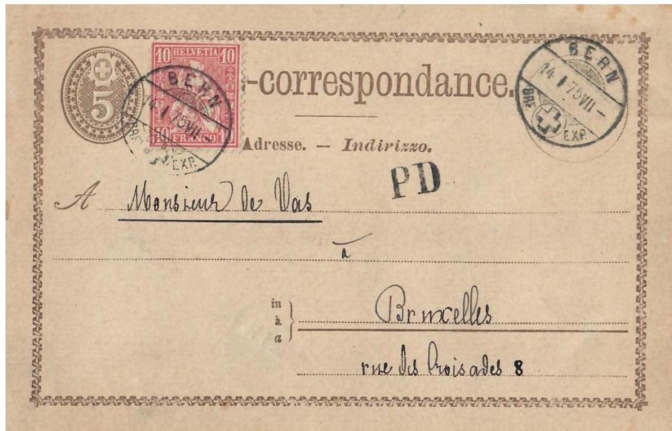
Abb.10: BERN - BRÜSSEL 14.I.1875

Noch vor Mitgliedschaft der Länder in der UPU, nämlich 1874 , war es Belgien , das auf Grund des Postvertrags vom 17.Dez.1862 und dessen Nachtragsvertrag vom 17.Dez.1868 mit der Schweiz für den gegenseitigen Korrespondenzkarten-Verkehr einen moderierten Tarif vereinbarte (Abb: 10 und 11) So konnten (lt. PA-Blatt vom 18.5.1874, Art.31) ab 1.Juni 1874 Korrespondenzkarten im gegenseitigen Austausch mit 15 Rp. frankiert aus der Schweiz nach Belgien resp. mit 15 Centimes frankiert aus Belgien in die Schweiz versandt werden!