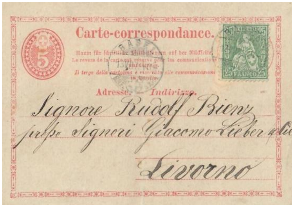
Abb. 2: BASEL - LIVORNO (ITALIEN) 13.VII.1873

Eine der ganz wenigen erhalten gebliebenen Korrespondenzkarten mit dem 30 Rp. Brieftarif (5+25 Rp.) - bei direkter Auswechslung - im Fernverkehr nach Italien zeigt sich mit der nächsten Abbildung. Gültiger Tarif bis 30.6.1875!