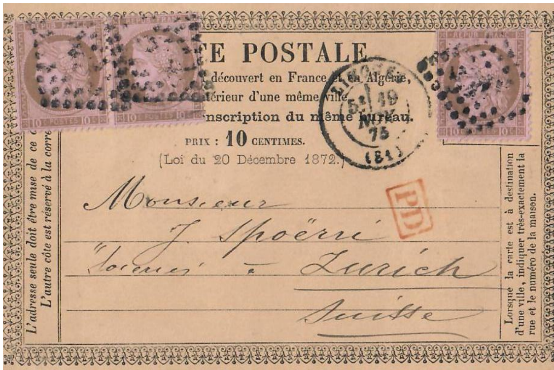
Abb. 6: LIMOGES/ FRANKREICH - ZÜRICH 19.NOV.1873

In Verbindung mit einer Schweizer Korrespondenzkarte (der 3.Ausgabe) sehen wir abermals den 30 Rp. Brieftarif nach Frankreich . Dieses Mal brauchte es aber „zwei Stationen“ zur korrekten Frankatur (Abb. 7). Die 5 Rp. Karte mit Adresse in Lyon wurde am 22.III.1875 ohne Zusatzfrankatur aufgegeben, war also um 25 Rp. zu wenig frankiert . Rechtzeitig wurde die unzureichende Gebühr bemerkt und die fehlenden 25 Rp. einen Tag später (am 23.III.1875) zum ordentlichen Tarif von 30 Rp. nachfrankiert .