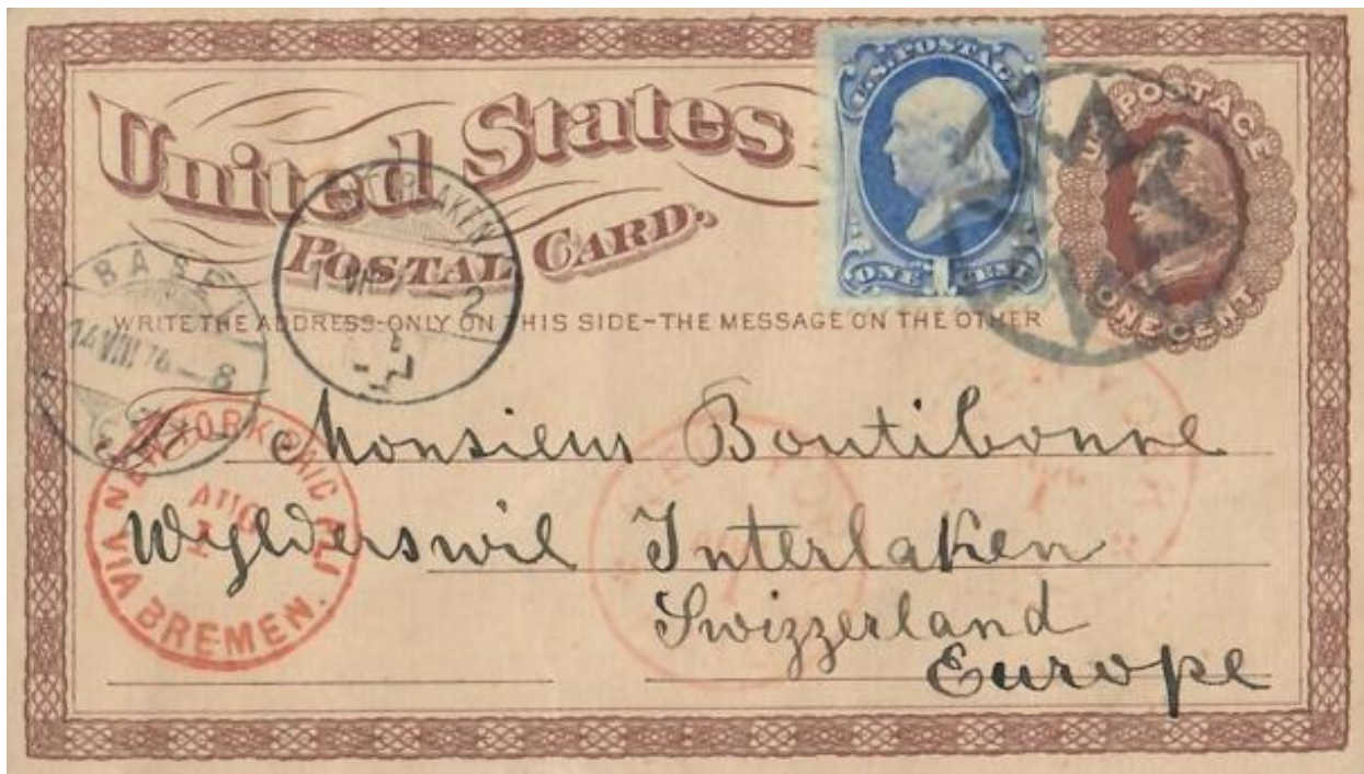
Abb. 19: NEW-YORK - INTERLAKEN 14.VIII.1874

Der Beitrag schliesst mit einer Korrespondenzkarte aus den USA in die Schweiz . Verwendung fand eine „Postal Card“ mit Werteindruck 1 Cent und einer 1 Cent Marke als Ergänzungsfrankatur. Total 2 Cent! Die Karte wurde über Bremen in die Schweiz nach Interlaken geleitet.