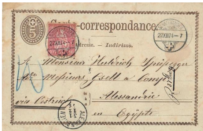
Abb. 16: SCHAFFHAUSEN - ALEXANDRIEN 22.XII.1874

Der seltene 15 Rp. Tarif nach Alexandrien (Ägypten) wird dokumentiert auf einer 5 Rp. Inland-Korrespondenzkarte (Zst.Nr.4) mit 10 Rp. Ergänzungsfrankatur. Die annullierten Bläuelnotizen weisen auf eine fehlerhafte Austaxierung hin. Man hatte die Karte mit vermeintlichen 50 Cts. belastet, aber rechtzeitig den Irrtum erkannt (siehe Leitwegnotiz „Via Österreich“ und Transitstempel von Triest!) Rückseitig Ankunftsstempel des österreichischen Postbüros von Alexandrien.