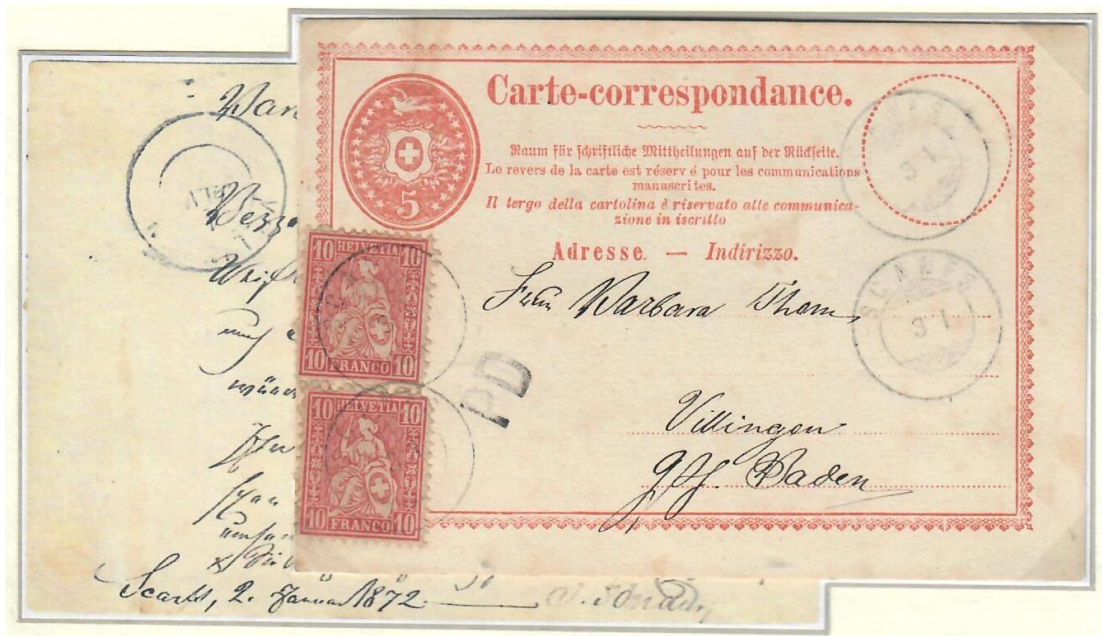
Abb. 6: SCANFS - VILLINGEN 2./3.I.1872

Der Brieffarif für Korrespondenzkarten in die benachbarten süddeutschen Staaten fand auch Anwendung mit ermässiger Taxe im Grenzrayon (RL) ! Wenn das Aufgabe- und Empfangsbüro nicht mehr als 7 geografische Meilen (= 52,5 km ) voneinander entfernt lagen, konnte die Karte mit 10 Rp. anstatt 25 Rp. frankiert werden, wie z.B. vorliegendes Exemplar in das Grossherzogtum Baden . Oft - aber nicht immer - weist ein RL-Stempel auf die reduzierte Taxe hin.