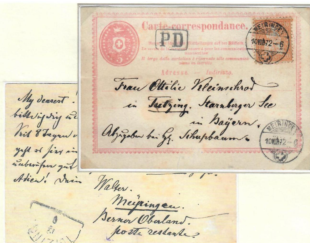
Abb. 14: MEIRINGEN (Kt. Bern) - TUTZING (Bayern) 10.VIII.1872

In das Königreich Bayern „begleitet“ uns eine Korrespondenzkarte, mit 25 Rp. Briefftarif frankiert (gültiger Tarif bis 31.12.1872), nach Tutzing /a. Starnberger See . Es ist nach Bayern die mir bisher einzig bekannte Karte zum Briefftarif!