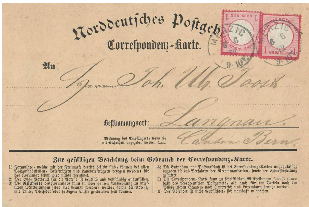
Abb. 3: MERZIG - LANGNAU (Kt. Bern) 6.6.1872

In umgekehrter Richtung sehen wir ein Exemplar aus dem Norddeutschen Postgebiet, das uns mit der 2 Groschen (2x 1 Gr.) Wertzeichenfrankatur ebenfalls den damals vorgeschriebenen Brieftarif von deutscher Seite in die Schweiz vor Augen führt.