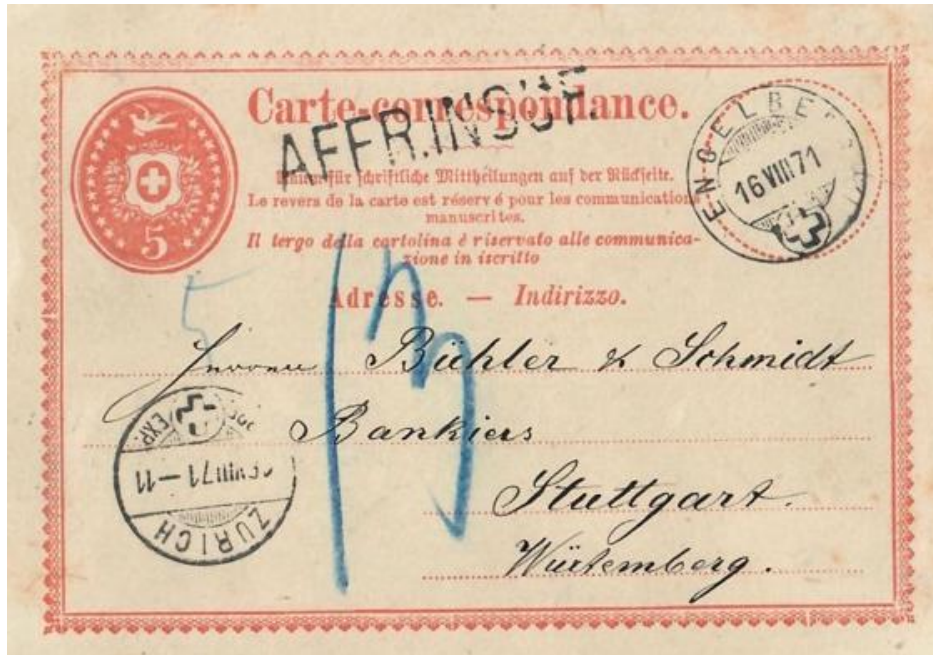
Abb. 10: ENGELBERG - STUTTGART 16.VIII.1871

Da unzureichend frankiert, musste die Karte wie ein unfrankierter Brief mit 14 Kreuzer belastet werden! Der 5 Rp. Wertstempel fand Anrechnung mit (umgerechnet) 1 Kreuzer. Vom Adressaten erhob man schliesslich 13 Kreuzer Nachporto! 13 Kr. waren umgerechnet 45 Rp., viel Geld für eine Postkarte damals.