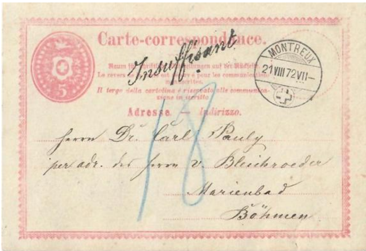
Abb. 18: ONTREUX - MARIENBAD/BÖHMEN 21.VIII.1872

Zu guter Letzt gibt es auch noch eine unzureichend frankierte Korrespondenzkarte nach Österreich (Fernverkehr) aus dem thematisierten Zeitrahmen (Abb:18). Auch in diesem Fall hatte man es vergessen (oder nicht gewusst), dass zur vorgeschriebenen Brieffrankatur noch ein Ergänzungswertzeichen von 20 Rp. vonnöten gewesen wäre, um der 25 Rp. Brieffaxe gerecht zu werden.