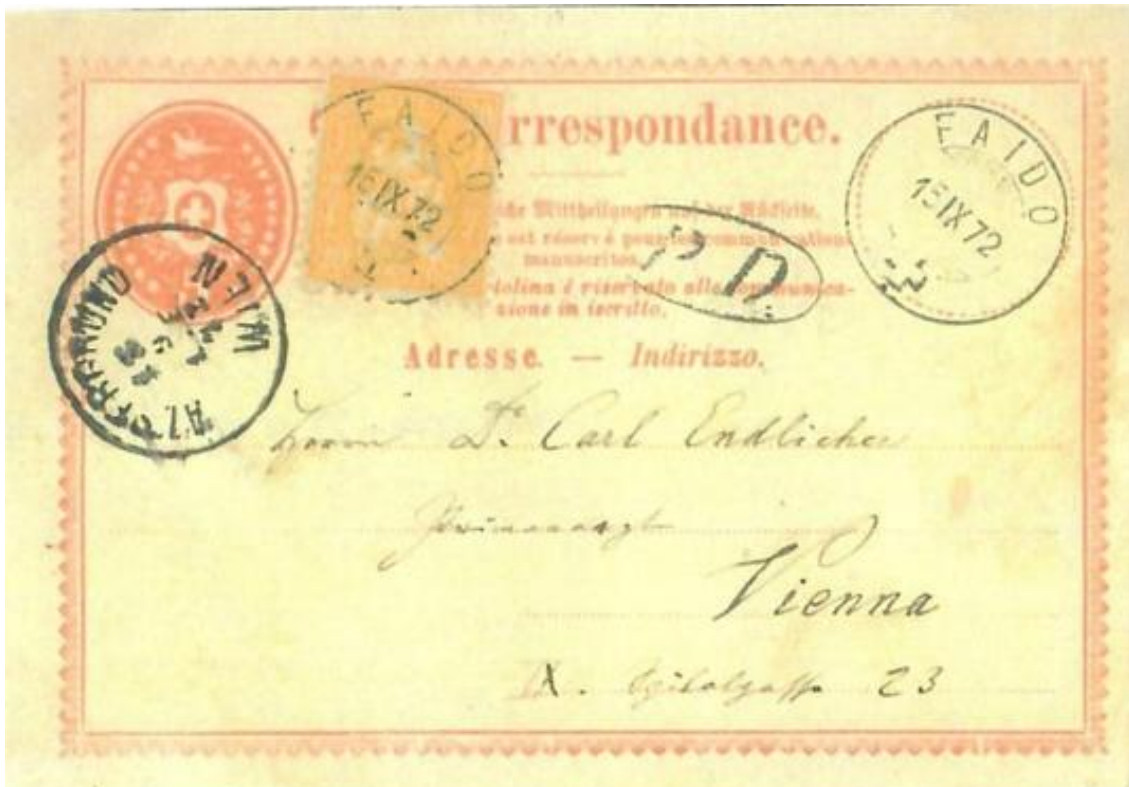
Abb. 17: FAÏDO (Kt. Tessin) - WIEN 15.IX.1872

Wie schon angedeutet, handelt es sich bei der Karte nach Wien um eine der ganz wenigen bekannten Korrespondenzkarten mit 25 Rp. Brief frankatur (5+20 Rp.) ins Nachbarland Österreich! Natürlich fand auch dieser Tarif nach Österreich am 31.12.1872 sein Ende. Ab dem 1.1.1873 konnten dann Postkarten dorthin - ebenso wie nach Deutschland - mit 10 Rp. freigemacht werden.