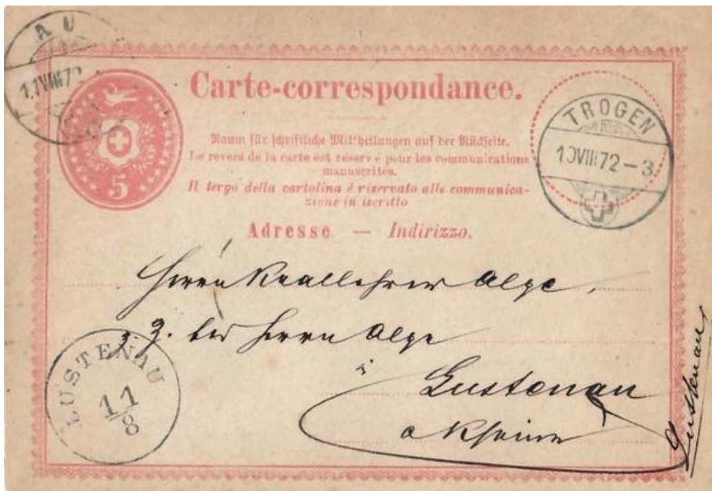
Abb. 15 TROGEN (Kt. Appenzell) - LUSTENAU (Vorarlberg) 10.VIII.1872

Dennoch ist es mir möglich, eine unzureichend frankierte Karte in den Grenzrayon (RL) des Nachbarlandes vorzulegen (Abb: 15). Auch hier wären zum 5 Rp. Wertstempel noch 5 Rp. zur reduzierten Brieffaxe von 10 Rp. mit Wertzeichen zu ergänzen gewesen. Für die ermässigte RL-Taxe durften zu dieser Zeit das Aufgabe- und Empfangsbüro max. 52,5 km (Luftlinie) voneinander entfernt liegen. Nur Postbüros, die diese Voraussetzung erfüllten, hatten das Privileg der reduzierten Gebühr!