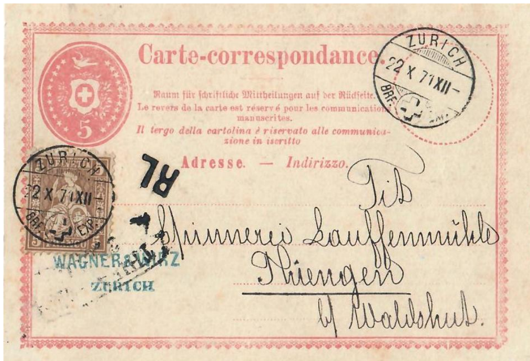
Abb. 7: ZÜRICH - THIENGEN/b. WALDSHUT 22.X.1871

Der Brieffarif für Korrespondenzkarten in die benachbarten süddeutschen Staaten fand auch Anwendung mit ermässiger Taxe im Grenzrayon (RL) ! Wenn das Aufgabe- und Empfangsbüro nicht mehr als 7 geografische Meilen (= 52,5 km ) voneinander entfernt lagen, konnte die Karte mit 10 Rp. anstatt 25 Rp. frankiert werden, wie z.B. vorliegendes Exemplar in das Grossherzogtum Baden . Oft - aber nicht immer - weist ein RL-Stempel auf die reduzierte Taxe hin.