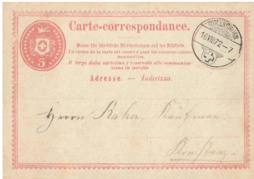
Abb. 8: ROMANSHORN - KONSTANZ 16.VIII.1872

Richtig behandelt hätte die Karte wie ein unfrankierter Brief in Konstanz mit 7 Kreuzer Porto belastet werden müssen, abzüglich des 5 Rp. Wertstempels (= 1 Kr.). Die Nachportobelastung für den Adressaten wäre dann bei 6 Kreuzer gelegen! Bei dem Geldwert damaliger Zeit war es Glück für den Empfänger. Der reduzierte Grenzrayontarif auf 10 Rp. hatte für Korrespondenzkarten nur Gültigkeit bis zum 31.12.1872!