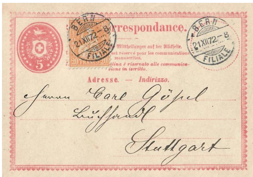
Abb. 9: BERN - STUTT GART 21.XII.1872

Der Brieftarif von 25 Rp. für eine Korrespondenzkarte traf auch für Sendungen in das Königreich Württemberg zu! Vorliegende 5 Rp. Karte ist mit einer 20 Rp. Marke ordentlich auf 25 Rp. ergänzt. Der Versand nach Stuttgart erfolgte nur zehn Tage vor Ablauf der Tarifgültigkeit. Bereits am 1.Jan.1873 konnten Korrespondenzkarten nach Deutschland mit 10 Rp. frankiert versandt werden!