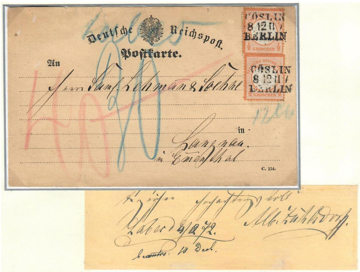
Abb. 12: STATION LABES (POMMERN) BAHNPOST-STEMPEL: CÖSLIN -BERLIN - LANGNAU i.E. 8.12.1872

Bei Abb:12 geht es um eine unzureichend frankierte Postkarte von Labes in Pommern nach Langnau/i. Emmenthal . Auf der Karte war nur 1 Groschen (2x ½ Gr.) verklebt. Es fehlte 1 Groschen zur korrekten 2 Groschen-Frankatur! Zum wiederholten Mal sehen wir den Bläuel-Vermerk „12“ unter den Marken, der lediglich den Umrechnungswert von 1 Groschen in 12 Rappen belegt. Die Postkarte selbst wurde auch in dem Fall wie ein unfrankierter Brief mit 50 Rp. belastet, abzgl. der geklebten 1 Gr. (= gerundet 10 Rp.) . Die Rötelnnotiz (li.) weist mit 40 Rp. auf das vom Empfänger zu bezahlende Nachporto hin . Die annullierte blaue „30“ wurde auf deutscher Seite notiert und zeigt die in der Schweiz zu erhebende Taxe in Pfennig-Währung an (30 Pfg. = gerundet 40 Rp.).