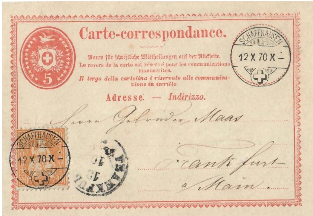
Abb. 2: SCHAFFHAUSEN - FRANKFURT am Main 12.X.1870

In umgekehrter Richtung sehen wir ein Exemplar aus dem Norddeutschen Postgebiet, das uns mit der 2 Groschen (2x 1 Gr.) Wertzeichenfrankatur ebenfalls den damals vorgeschriebenen Brieftarif von deutscher Seite in die Schweiz vor Augen führt.