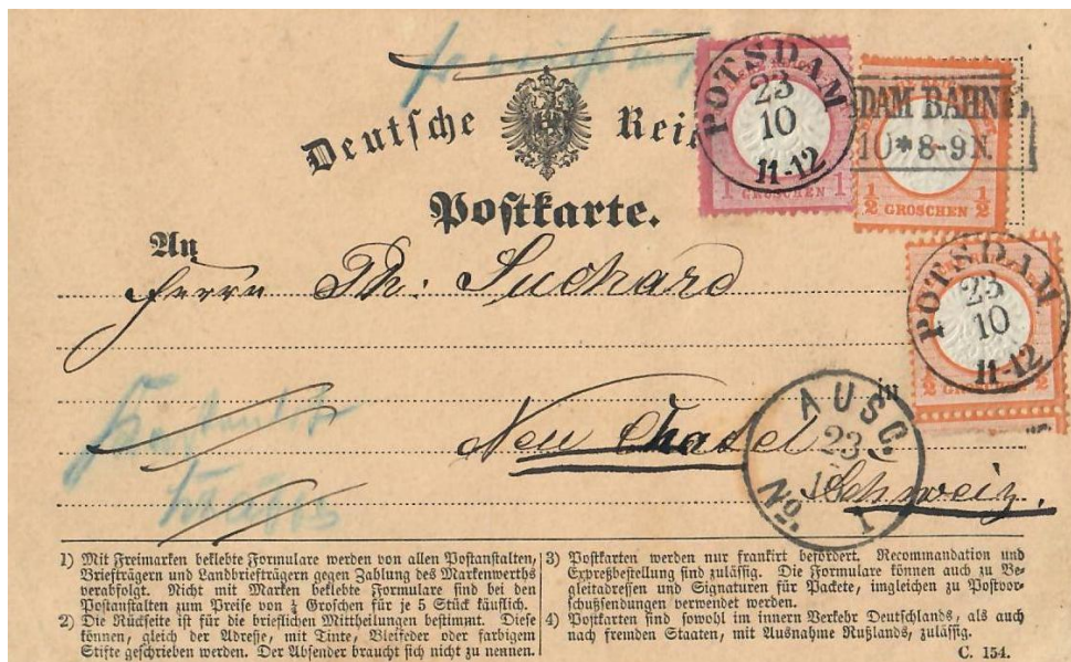
Abb. 11: POTSDAM - NEUCHÂTEL 23.X.1872

Da man Korrespondenzkarten zum Brieffarif aus dem kurzen Zeitraum von 2¼ Jahren (1.Okt.1870 – 31.Dez.1872) von beiden Seiten der Grenze - Schweiz/Deutschland/Schweiz - gar nicht oft findet, gehören zu den seltenen „Gästen“ in diesem Beitrag natürlich auch Postkarten aus dem Deutschen Reich in die Schweiz (Abb: 11+12). Beachtenswert die unterschiedliche postalische Behandlung beider Exemplare.