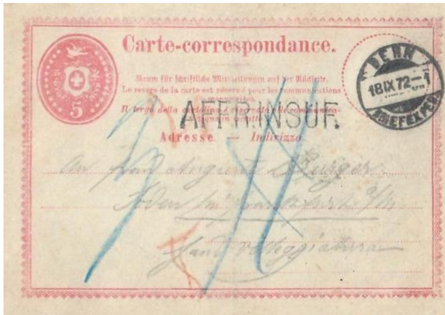
Abb. 13: BERN - SODEN (Dt. Reich). 18.IX.1872

Soden gehörte zum Herzogtum Nassau und war seit 1.1.1868 Groschengebiet Nun, man erkannte rechtzeitig den Fehler, annullierte mit zwei Blaustrichen die „11“ und belastete die Korrespondenzkarte wie einen unfrankierten Brief mit 4 Groschen , abzüglich und gerundet den 5 Rp. Wertstempel (umgerechnet 1 Gr.). Dem Adressaten verblieben 3 Groschen Nachporto zu bezahlen.