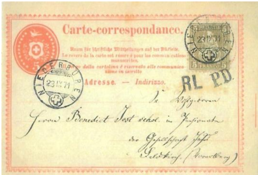
Abb. 16: NIEDERBÜREN (Kt. St. Gallen) - FELDKIRCH (Vorarlberg) 23.IX.1871

Wie schon angedeutet, handelt es sich bei der Karte nach Wien um eine der ganz wenigen bekannten Korrespondenzkarten mit 25 Rp. Brief frankatur (5+20 Rp.) ins Nachbarland Österreich! Natürlich fand auch dieser Tarif nach Österreich am 31.12.1872 sein Ende. Ab dem 1.1.1873 konnten dann Postkarten dorthin - ebenso wie nach Deutschland - mit 10 Rp. freigemacht werden.